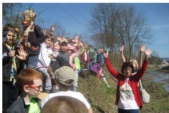
Vynášení Moreny – školní družina