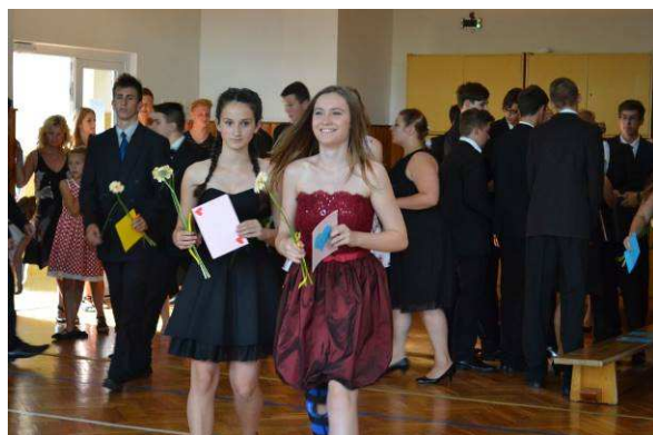
Slavnostní rozloučení žáků 9. ročníku se školou