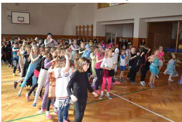
Karneval – školní družina