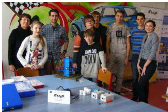
Soutěž týmů - T-profi