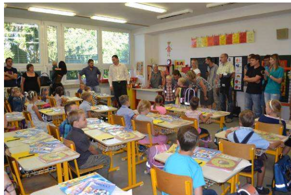
První školní den v 1.A