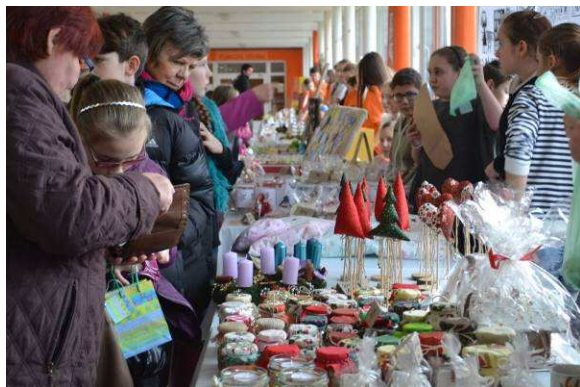
Vánoční jarmark v aule