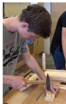
Spolupráce s SŠNNN Bystřice pod Hostýnem