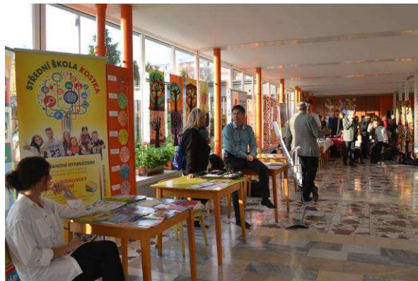
Burza středních škol