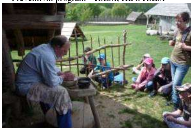
Exkurze Modrá – Velehrad