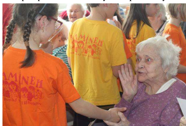
Navštěvujeme Centrum pro seniory