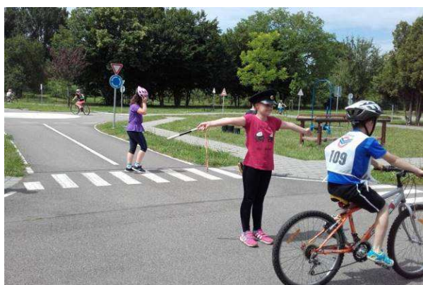
Dopravní hřiště – 4. ročník