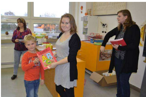
Předávání slabikářů v 1. třídách