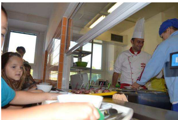
Vaříme s LAGRISEM