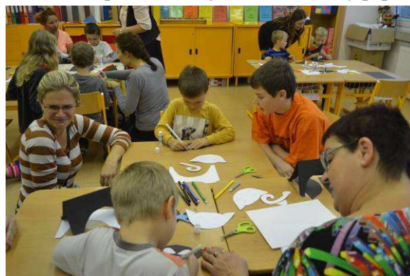
Podzimní dílny PŘEDŠKOLÁKA