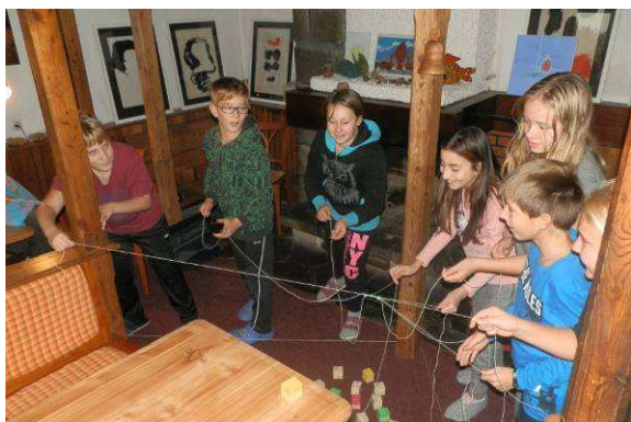
Adaptační kurzy – 6. ročník