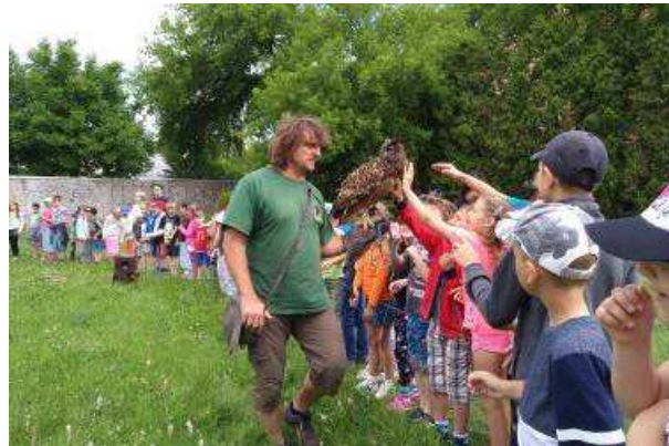
Dravci a sovy