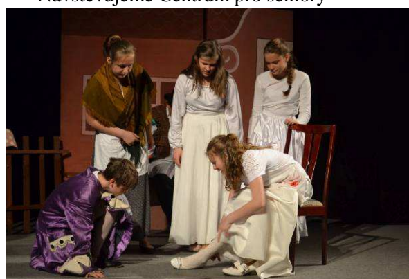
Divadelní představení POPELKA