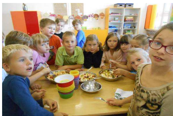
Jablíčkový týden ve školní družině