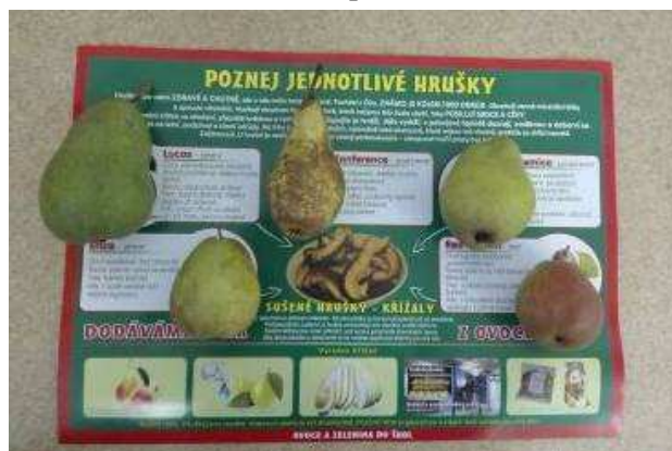
Ochutnávka hrušek z OVOCENTRA