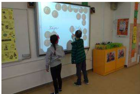
Učíme se moderně – interaktivní tabule