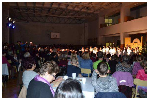
Vánoční koledování – školní družina