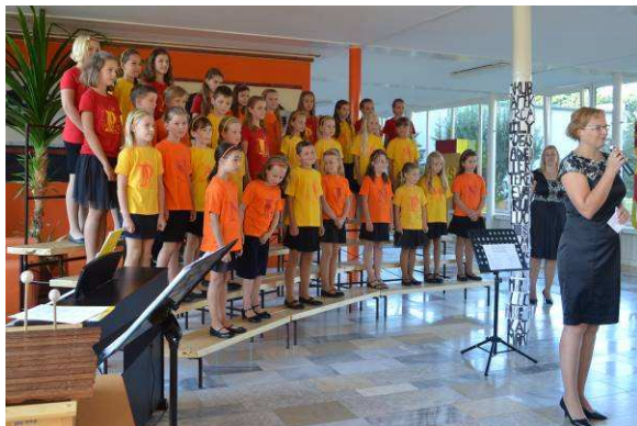
Zahájení školního roku 2016/2017