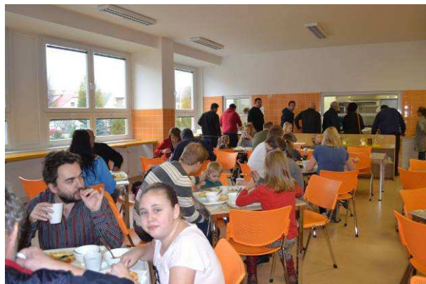
Sobotní oběd pro rodiče