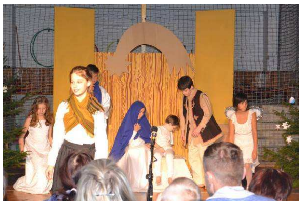
Vánoční koledování – dramatický kroužek