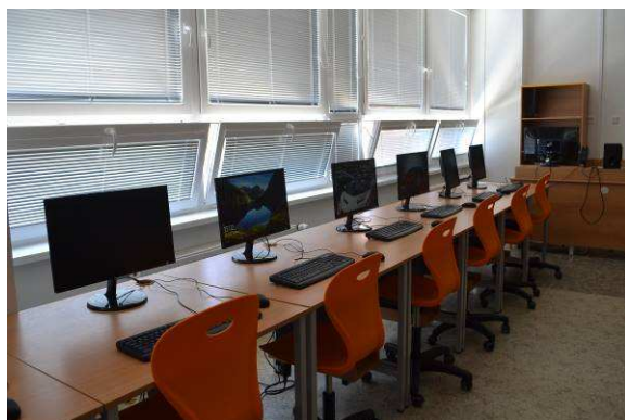
Slavnostní otevření rozšířené počítačové učebny