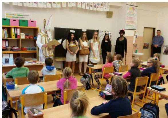
Mikulášská nadílka ve škole