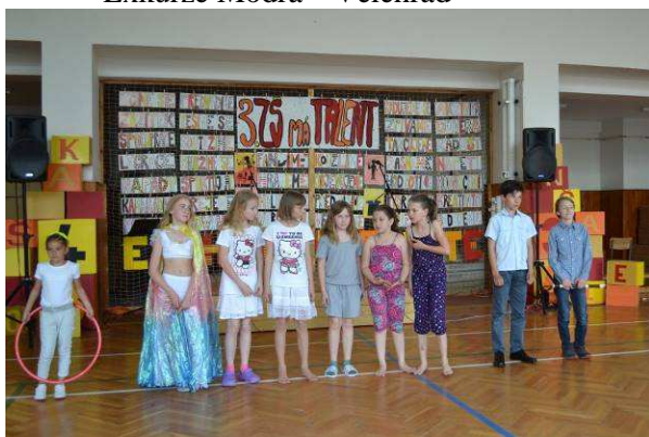
Soutěž 3. ZŠ má talent – Spolek žáků