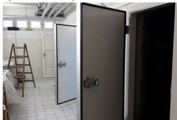
Rekonstrukce chladícího zařízení