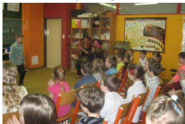
Recitační soutěž – 1. stupeň