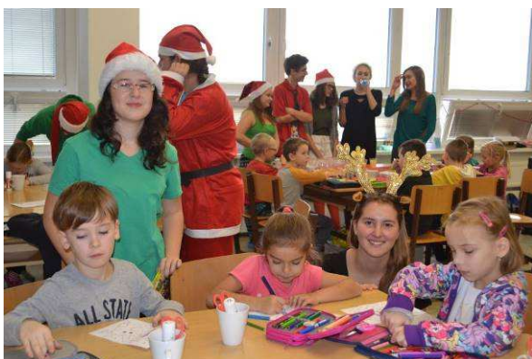
Den národů – Spolek žáků