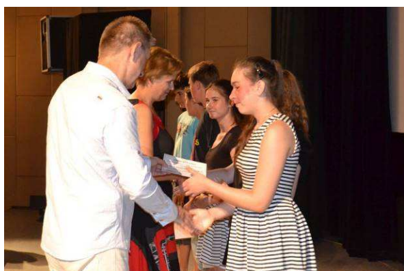
Předávání ocenění – konec školního roku