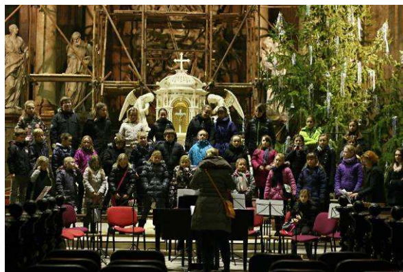
Koncert v kostele