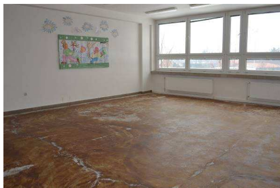
Výměna podlahových krytin