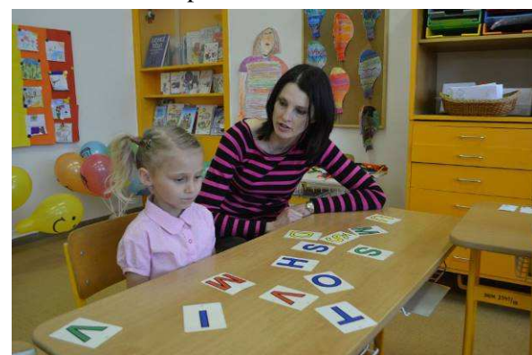
Zápis do 1. ročníku