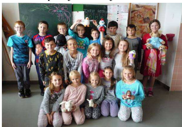
Pyžamový den – Spolek žáků