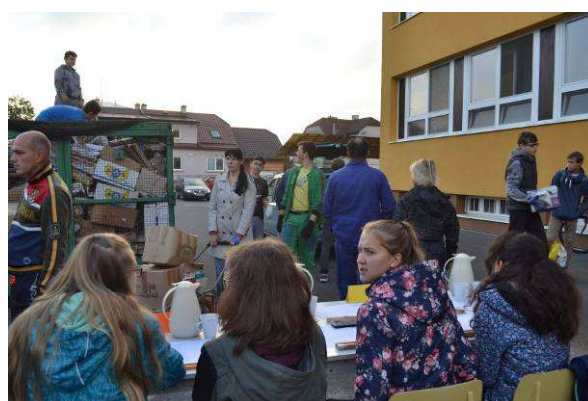
Na podzim a na jaře sbíráme starý papír