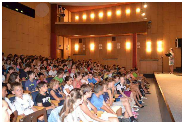
Vyhodnocení školního roku v kině Svět