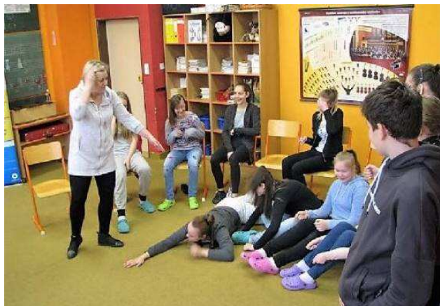
Preventivní program – JSEM, KDO JSEM