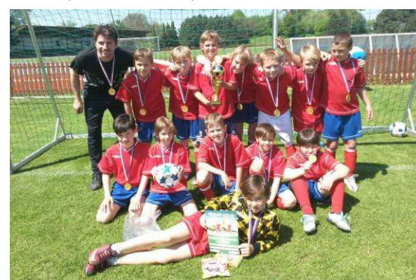
McDonald cup – vítězství v okresním kole