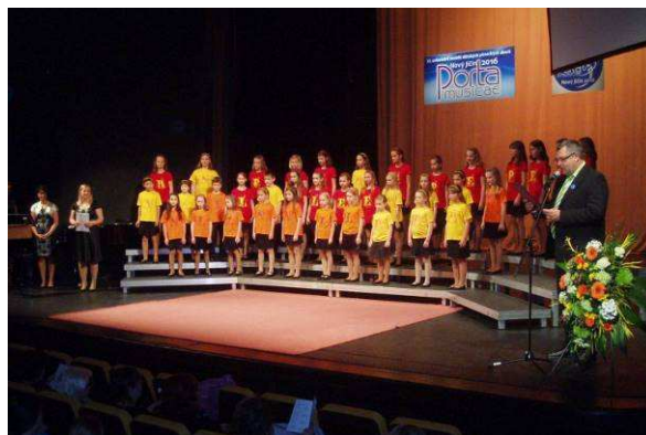
Pěvecký sbor na celostátní soutěži