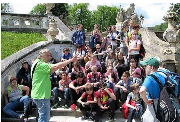
Exkurze Český Krumlov