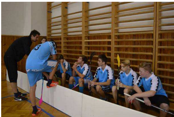
Sportujeme – hrajeme florbal