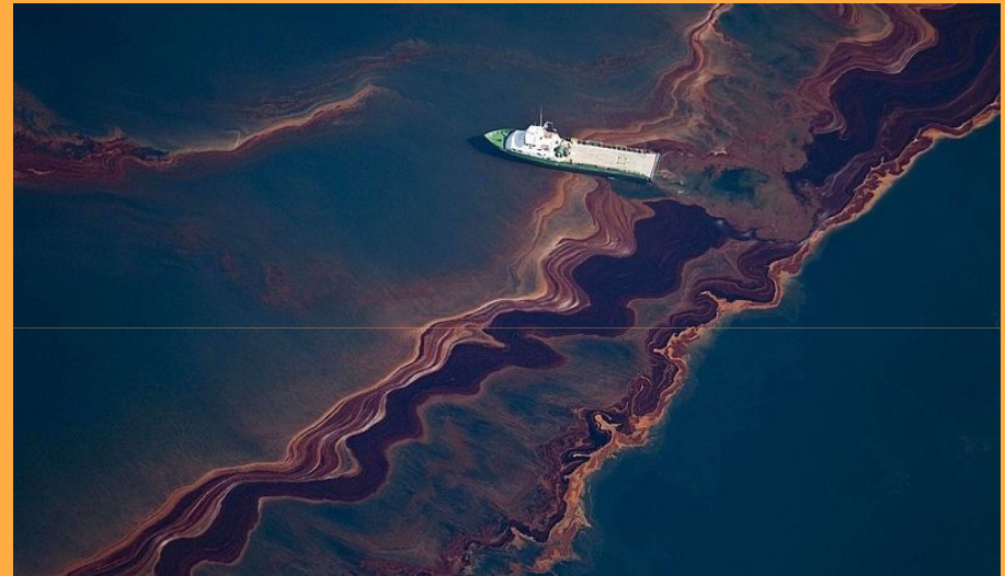
ropná skvrna v Mexickém zálivu